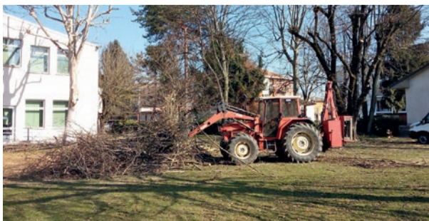
Le potature nel giardino della scuola elementare