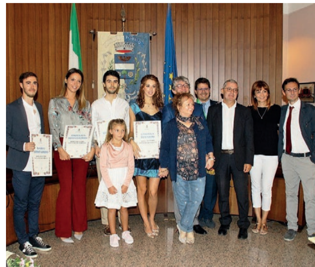
La consegna delle borse di studio delle scorso anno

Per gli studenti specializzandi in Economia della provincia di Pavia ultimo mese di tempo per presentare la domanda per le borse di studio intitolate alla memoria del compianto Ottavio Signorelli, benefattore robbiese scomparso nel 2012. I laureati in materie economiche hanno tempo fino al prossimo 31 marzo per inviare la propria documentazione agli uffici comunali e accedere a una delle sei borse di studio dall'importo di 5mila euro ciascuna, finalizzate alla frequenza, anche all'estero, di corsi di studio specialistici o magistrali, o di corsi di specializzazione, o di master, nelle discipline connesse con l'economia politica o con le scienze delle finanze. «Una bellissima opportunità - hanno commentato il sindaco e assessori - per gli studenti robbiesi, lomellini e pavesi. Questa borsa di studio è stata fortemente voluta da Signorelli, tramite un cospicuo lascito testamentario». Tutte le informazioni sono sul sito istituzionale del Comune di Robbio.