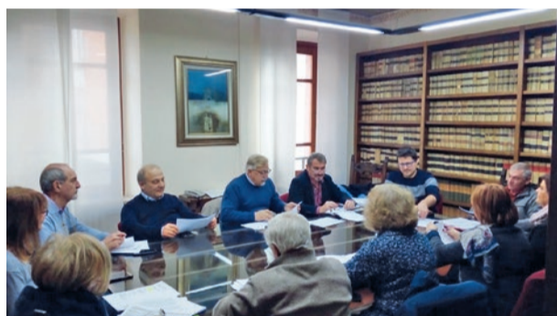
Il tavolo della trattativa tra amministratori e sindacati

Irpef comunale azzerata per i tutti redditi fino a 12mila Euro. Questo l'ottimo risultato ottenuto a metà febbraio al termine della consueta contrattazione d'inizio anno fra amministrazione comunale e rappresentanti delle principali sigle sindacali. «Anche in questa occasione - spiega il sindaco Roberto Francese - l'accordo con i sindacati si è concluso con successo. Abbiamo ridotto le tasse, soprattutto per le pensioni basse, innalzando la soglia di esenzione totale a 12mila euro, sia per i pensionati, sia per tutti i lavoratori dipendenti».