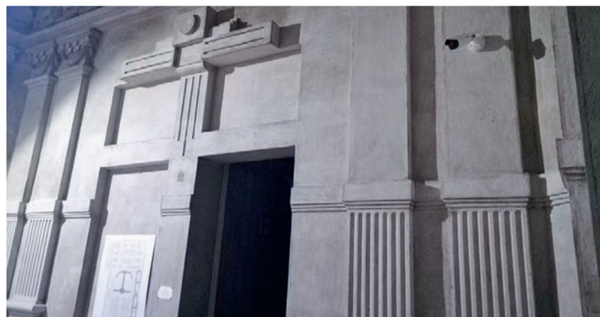
Sei nuove telecamere sono già funzionanti al cimitero di via XI Febbraio

Anche nel cuore della cittadina, negli incroci principali e nei pressi delle strutture comunali più rilevanti le telecamere saranno implementate e ammodernate. «I nuovi occhi elettronici - spiegano il sindaco France-