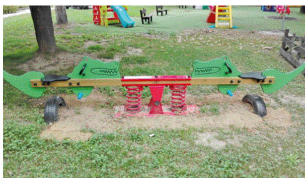
Gli interventi hanno riguardato anche l'esterno della struttura