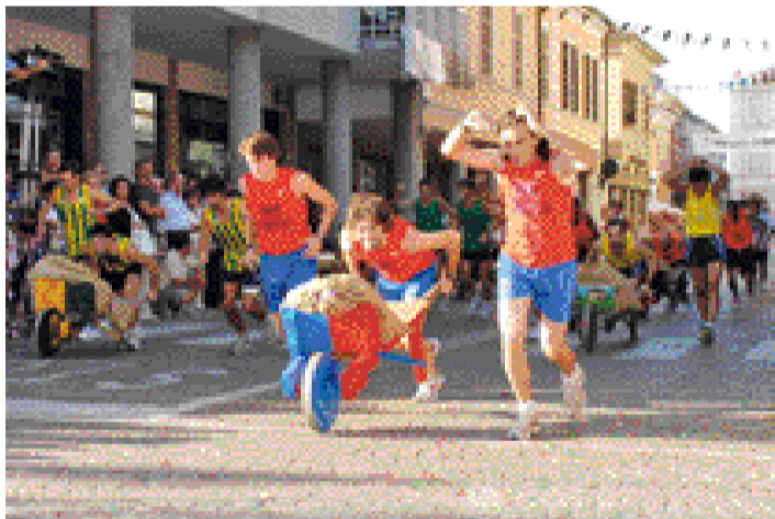
L'emozionante corsa con le carriole e, a destra, la processione della Madonna del Rosario in programma domenica mattina

Fagnola, benedirà le nuove campane dalla chiesa di Santo Stefano e il Palio di Robbio. Al pomeriggio, a partire dalle 16, la sfilata storica con oltre cinquecento figuranti in costumi d'epoca, mentre alle 18 ci sarà l'emozionante corsa con le carriole: il vincitore si aggiudicherà il palio numero 32. A seguire la maxi paniscia da 1.500 porzioni. Attese a Robbio per il pomeriggio di festa numerose autorità civili e militari: fra queste i sindaci della Lomellina e il nuovo presidente della Provincia di Pavia.