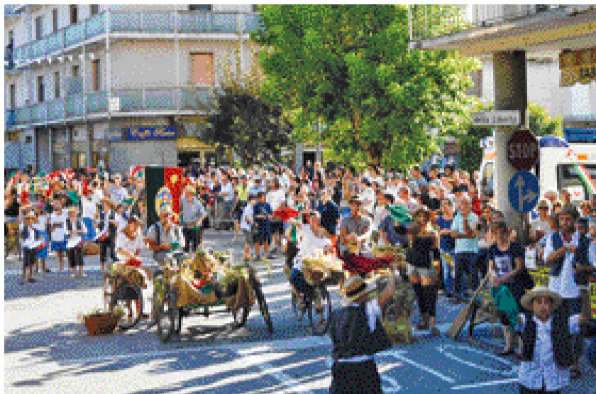
La sfilata storica lungo le vie centrali della cittadina