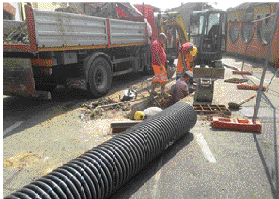
I lavori di ripristino della rete fognaria di via Novara dopo i copiosi temporali estivi