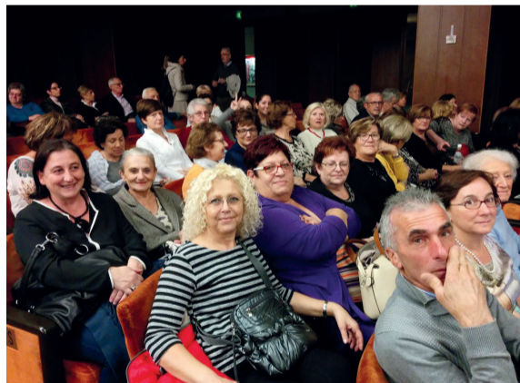
Un gruppo di robbiesi in trasferta a teatro

simo 24 marzo. Inoltre proseguiamo con i giovedì dell'Università del Tempo Libero fino all'ultima settimana di aprile: la partecipazione alle conferenze è sempre libera e gratuita».