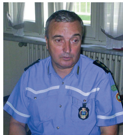
L'ex comandante Francesco Dal Moro

Dal 31 gennaio lo storico comandante della Polizia locale Francesco Dal Moro è in pensione: dall'inizio del mese di marzo al suo posto ha preso servizio Luciano Legnazzi, già capo dei vigili di Cilavegna.