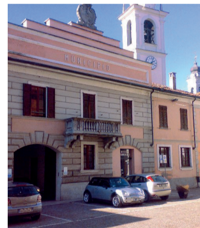
Nel 2018 in municipio si sono sposate quattro coppie