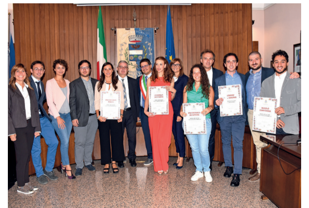
I giovani che hanno ricevuto la borsa di studio Signorelli

«Una bellissima opportunità - hanno commentato il sindaco e assessori - per gli studenti robbiesi, lomellini e pavesi. Questa borsa di studio è stata fortemente voluta dal benefattore Ottavio Signorelli tramite un cospicuo lascito testamentario in favore del Comune di Robbio e nello scorso settembre sono stati premiati cinque ragazzi della provincia, fra questi anche i robbiesi