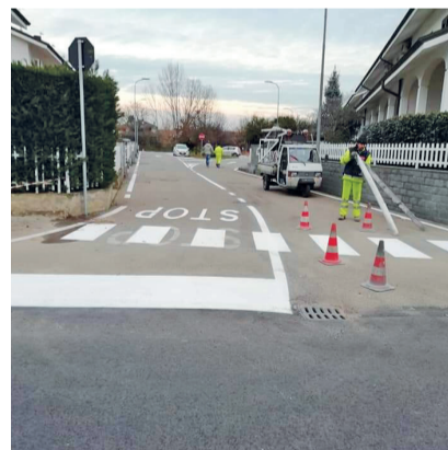
Alcune immagini degli interventi che hanno interessato strade e marciapiedi di Robbio a dicembre. A sinistra, i lavori per il restyling di via Falcone. Al centro, la realizzazione della rotonda in viale dell'Artigianato. A destra, il rifacimento dei marciapiedi in via Risorgimento