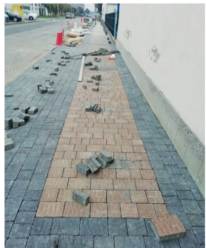
Il maquillage in viale Gramsci