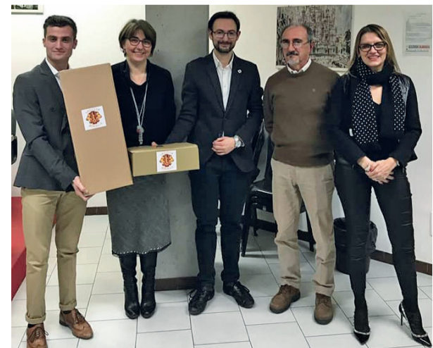
La consegna dei pacchi donati dal Leo Club Biraga